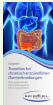
Ratgeber Transition bei chronisch entzündlichen Darmerkrankungen