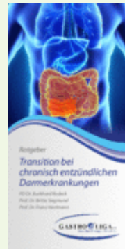
Ratgeber Transition bei chronisch entzündlichen Darmerkrankungen