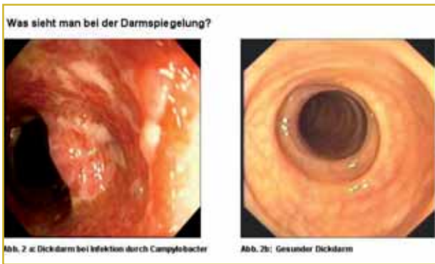
Abb. 2: Darmspiegelung – endoskopisches Bild: Dickdarm bei Campylobacter-jejuni -Infektion (a) und normaler Dickdarm (b)

grunde. Ganz anders verhält es sich mit den sogenannten invasiven Durchfallerregern, wie z.B. Campylobacter , Shigellen oder Amöben: diese durchwandern die Darmzelle und schädigen sie dabei. In den Gewebeschichten, die unterhalb der Darmschleimhaut liegen, lösen sie eine schwere Entzündungsreaktion aus (siehe Abb. 2a), welche den Verlust von Wasser und Salzen nach sich zieht. Durch die Zerstörung von Darmzellen, kommt es zu blutigem Durchfall. Geraten die Erreger in die Blutbahn, kann es zu schweren Krankheitsbildern kommen.